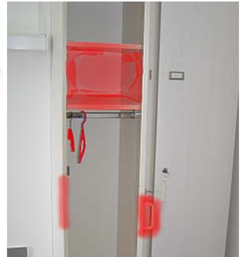
Aufbereitung bei Entlassung oder Verlegung - rot = erforderliche desinfizierende Reinigung